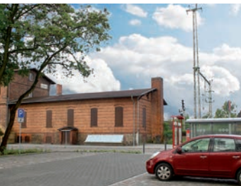
Kostenlose Park & Ride-Plätze