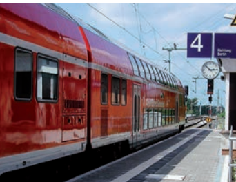
Doppelstockwagen nach Berlin